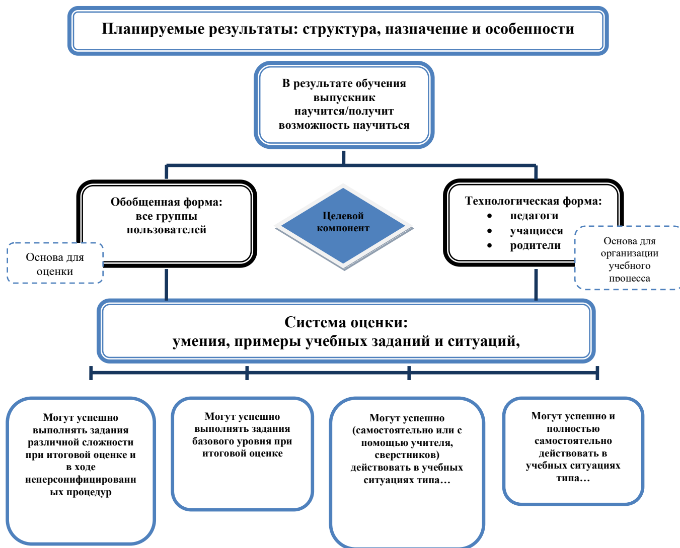
Рис. 1. Особенности структуры планируемых результатов. Функция и назначение.

Система оценки достижения планируемых результатов освоения основной образовательной программы основного общего образования: