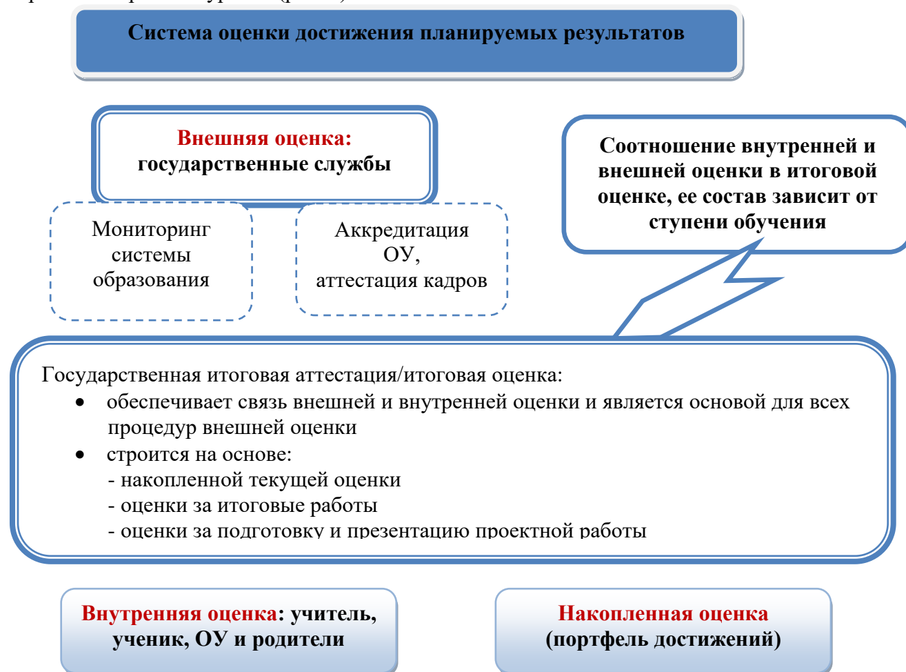
Рис. 2. Система оценки достижения планируемых результатов

Полученные данные используются для оценки состояния и тенденций развития системы образования разного уровня (рис. 2).